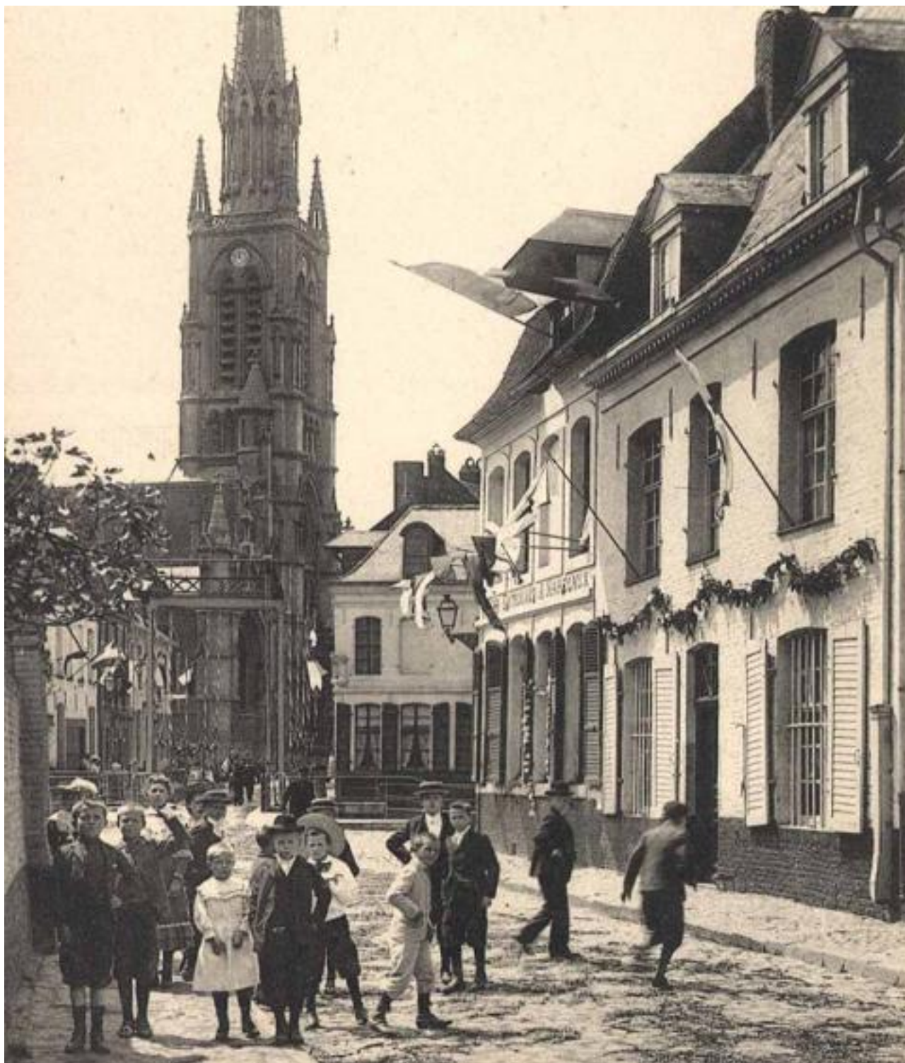
Wambrechies au début du XXe siècle