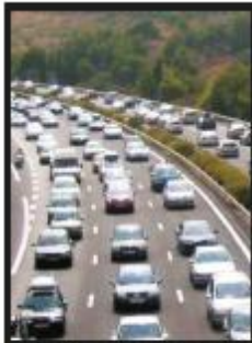
Saturation des réseaux : LMCU dévoile son Plan de Déplacements Urbains > pages 12-13