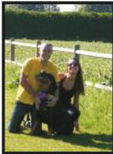
Balade dans les prairies de l'aérodrome > page 3